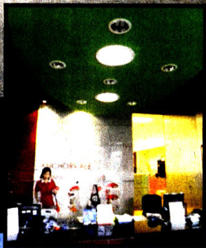
▶联络所办公室内使用太阳能发电的照明。