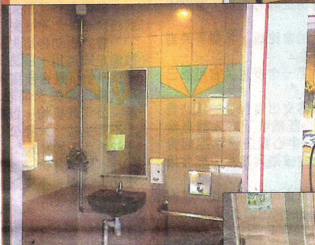
▶美景路 第159座熟食中心