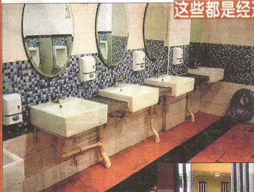
◀惹兰红山 第6座熟食中心 ★★★