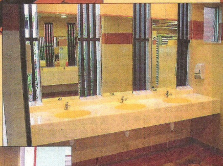
▲丹戎巴葛 第6座熟食中心