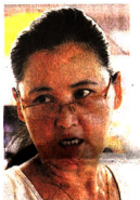
主妇许太太说, 外面的人可以看进女厕内, 确实不雅观。