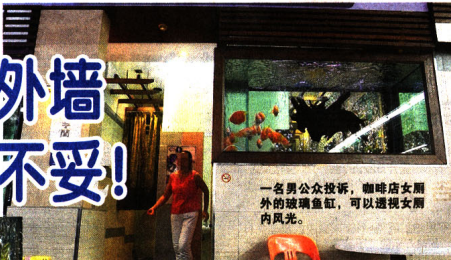
一名男公众投诉, 咖啡店女厕外的玻璃鱼缸, 可以透视女厕内风光。