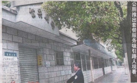
公厕推出套餐服务吸引路人观看。

然而, 最引人注目的当属豪华套餐, 收费10元人民币, 便能享有专业陪聊服务, 目的是让消费者上厕所不会无聊。对此, 网友表示很感兴趣: “不知道在上厕所时, 还有人在旁边陪你谈心, 是什么样的感觉?” 许多网友对此创意大感佩服, 大赞: “实在太有才了!” 也有网友问: “信用卡能刷吗?” “如果可以刷卡分期就好了。” 目前询问的人虽然不少, 却尚无顾客购买。