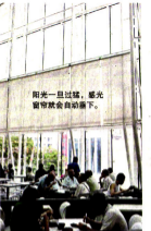
阳光一旦过猛,感光窗帘就会自动垂下。

凉爽但不“冷酷” 建筑构造与节能冷气配合无间才能达到最佳省电效果。洪奕龙说,这要在策划阶段就预算好,增加建筑抗热的能力。商场窗外采用铝镜片,避免阳光直射,使用Low-E隔热玻璃落地窗,落地窗高处还加上窗台设计,在减少热量的同时也能让太阳照进室内。此外,天花花园的植物、凉亭等也能减少屋顶的热量。通过这些技术先使室内凉爽,启动冷气时就不需要太多的能源,省电效率增加34%。 >>感应节能器 大家熟悉的感应节能器,好比聪明的电梯、电梯梯,会根据人的数量、重量多寡而调节电车。酒店也多用地玻璃窗采集自然光及感应器开关电灯。