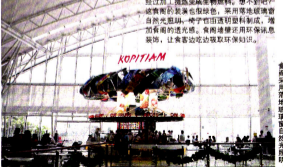
食商采用落地玻璃窗自然光照耀。

迎接电能车时代 在清洁能源未来来临前,大家一定很熟悉“HD-Ready”电视机,而City Square City Square商场早已准备好了10个车位给混合动力车(hybrid car)和4个车位的电动车(electric car)。电动车专用的车位旁还有充电台方便充电(充电)有懂的,是,hybrid车位属黄金车位,就靠商场电梯走,如此一来,垃圾桶是完全封闭的,除能保持卫生,减少臭味,防止虫外,也方便垃圾回收厂分类平板,取出更多能再生循环的垃圾。 >>清洁生物燃料 原属Kopitiam商号与Alpha Biodiesel公司合作,设有4个巨大的收集桶,小瓶吃完食物后,就把油放进收集桶内回收,经过加工提炼成生物燃料。想不到吧?这实际的装置也很绿色,采用落地玻璃窗自然光照耀,樟子木面透铝制成,增加有机的透光感。食商墙壁还用环保信息装饰,让食客边吃边取环保知识。