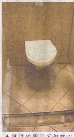
▲肮脏的厕所不但难以使用，臭味还随风飘到外头去。