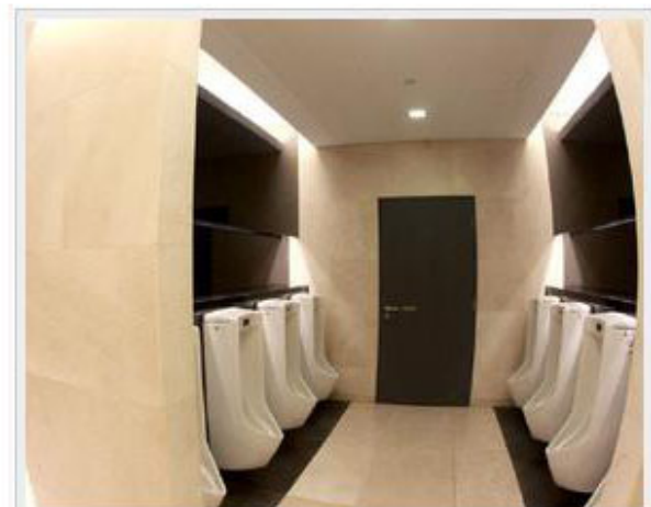
Ion Orchard商场厕所内设荧光屏幕播放广告。(图/档案照片)

而美国、德国、荷兰和中国等地的商家也在九十年代中旬就已开始将广告搬到厕所里, 在人们如厕“无聊”时, 趁机向他们宣传商品。