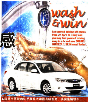
▲陈笃生医院的洗手赢奖活动很有吸引力，头奖是辆轿车。